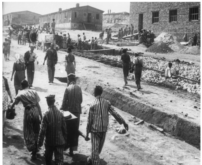
Więźniarki i więźniowie podczas prac w części przemysłowej obozu, 1944