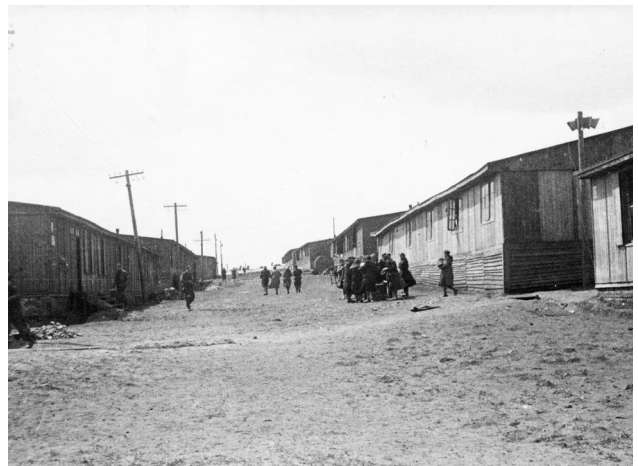
Droga w nowej części przemysłowej obozu, 1944, ze zbiorów Gerharda Madritscha

Zaraz po wojnie miasto Kraków i władze państwowe, osoby indywidualne i stowarzyszenia podejmowały działania, aby wiedza i pamięć o tym miejscu przetrwały. Przez wiele lat ich głównym symbolem był postawiony na miejscu straceń Pomnik Ofiar Faszyzmu. Od 2016 roku w proces upamiętnienia włączały się krakowskie instytucje, w tym przede wszystkim Muzeum Krakowa, a w styczniu 2021 roku do opieki nad tym miejscem zostało powołane Muzeum KL Plaszow.