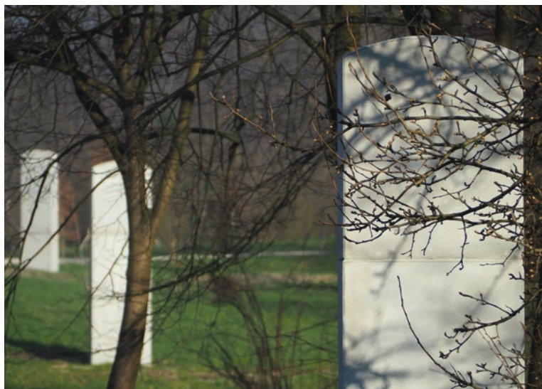
Ryc. 2 Pylony wyznaczające granice miejsca pamięci przy ul. Swoszowickiej

Dzięki zastosowanym środkom opowieść o byłym obozie zyskuje realny wymiar dla każdego odwiedzającego. Przestaje być historyczną abstrakcją, a przez odesłanie do konkretności pokazuje, że to wszystko nie tylko zdarzyło się naprawdę – ale zaszło właśnie tutaj.