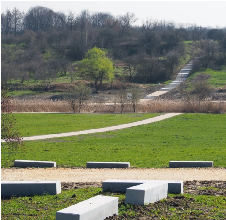
Ryc. 4 Lokalizacja plansz wystawy stałej w przestrzeni miejsca pamięci KL Płaszów